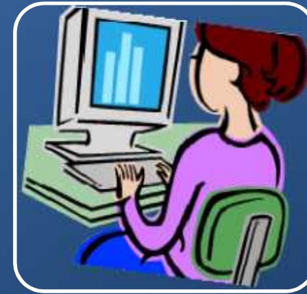
Petugas Front Office PTSP